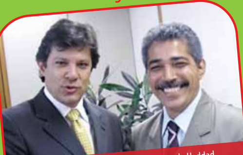
Ministro da Educação, Fernando Haddad, e Leonardo Monteiro.

O prestígio e influência do deputado em Brasília tem garantido as condições para que as cidades mineiras recebam recursos do Governo Federal.