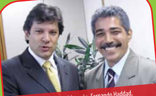
Ministro da Educação, Fernando Haddad, e Leonardo Monteiro.

O prestígio e influência do deputado em Brasília tem garantido as condições para que as cidades mineiras recebam recursos do Governo Federal.