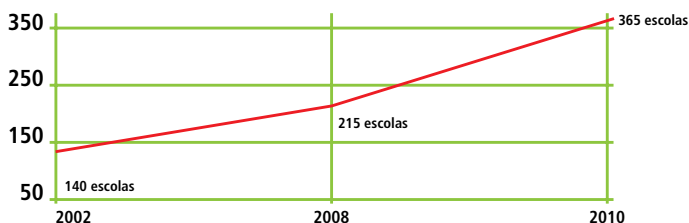
CENÁRIO DA REDE FEDERAL ATÉ 2010

A rede federal de educação do Brasil teve início em 1909, pelo o então presidente da República, Nilo Peçanha, com o objetivo de atender as “classes desprovidas”. Cem anos depois o Governo Lula transforma a configuração da rede federal de ensino que passa a possibilitar o acesso de todas as pessoas às conquistas científicas e tecnológicas.