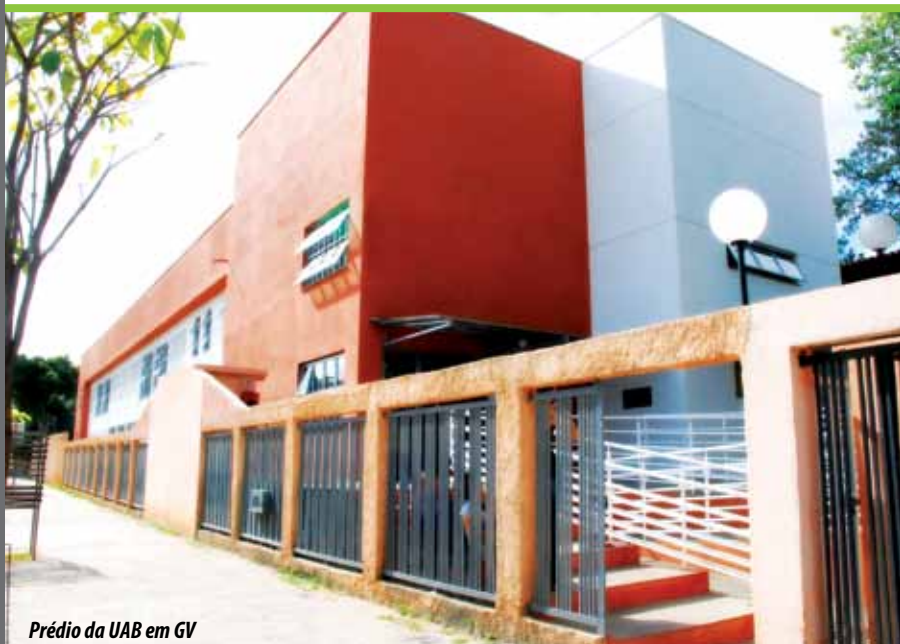
Prédio da UAB em GV

O deputado é responsável também pela Universidade Aberta de Pescador que tem parceria com a Universidade Federal de Juiz de Fora (UFJF) e oferece à comunidade os cursos de Bacharelado em Administração e Licenciatura em Pedagogia.