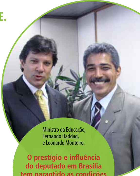
Ministro da Educação, Fernando Haddad, e Leonardo Monteiro.

Investir na educação é contribuir para a geração de empregos, para a melhoria da distribuição de renda e para o desenvolvimento econômico de uma região.